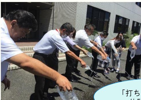
北九州教育事務所