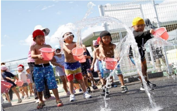
宮若さくらこども園（宮若市）

今年の「打ち水大作戦」では、新型コロナウイルス感染症が5類感染症になったことから、一般参加を呼び掛ける機関も多くありました。実施機関からは「下がった温度以上の涼しさに打ち水の効果を実感することができた」「日本古来より伝わる打ち水の良さを職員間で共有することができた」等様々な感想が寄せられました！