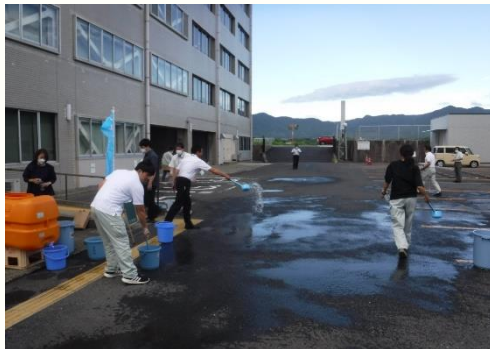
直方県土整備事務所