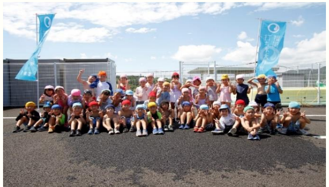
古月保育所（鞍手町）