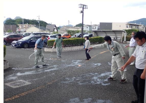
田川県土整備事務所